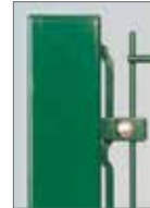
Bevestigingsstrip + specifieke bevestigingsklemmen