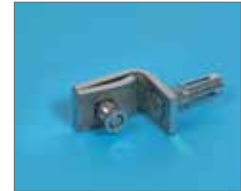
Verbindingsklem tussen poortpaal en afraasteringspaneel