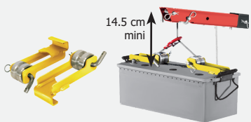
Haak voor accu's Max. 60 Kg.