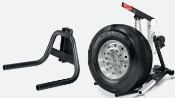
Hefvork voor wielen Ø van 80 tot 120 cm Max. 200 Kg

Heffen van schijfnaven, direct met de kabel en de haak.