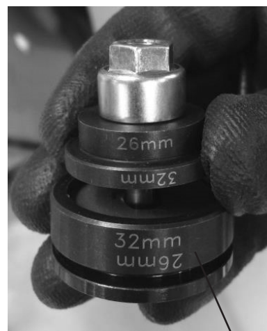
1 disque de coupe supérieure avec deux diamètres : 26 mm en bas et 32 mm en haut