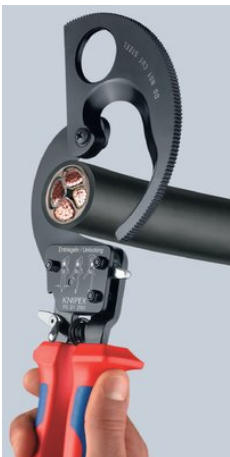
95 31 280: Grote capaciteit: max. Ø 52 mm / 380 mm 2