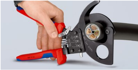
95 31 250/280: handgreep van het vaste greep met steunvlak voor tijdens het snijden