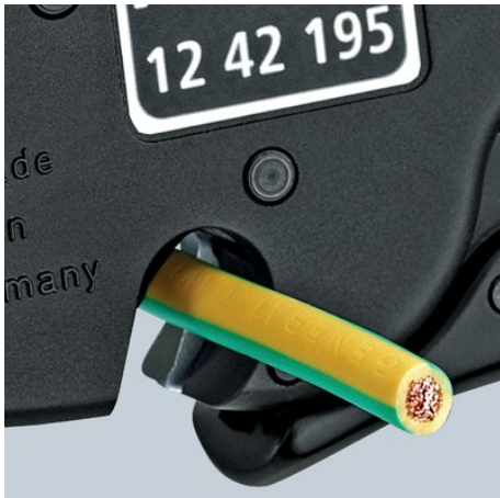
Draadsnijder tot 10 mm 2 meerdradig